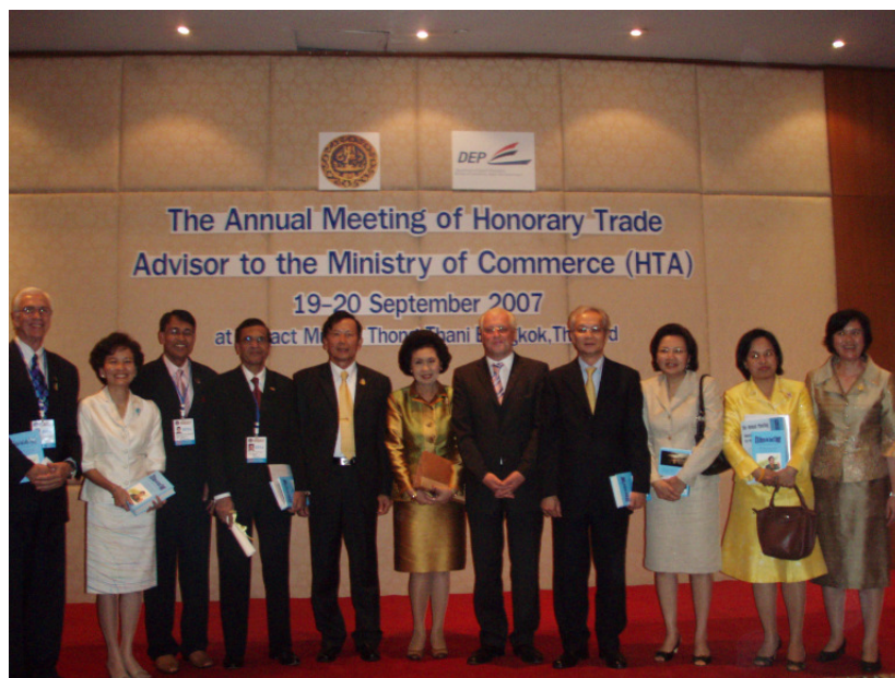
HTAs USA, Australia, Pakistan, Bangla Desh, Supreme Commander Boonsrang Niumprasit, Deputy Minister of Commerce Secretary Oranoj Osatananda, Trempel (Germany), Director-General Department of Export Promotion Rachane Potjanasuntorn, Minister Counsel. Kessiri, (Washington) DEP Board- from left

Die Rückkehr zur Demokratie sei die Grundvoraussetzung für jede weitere Zusammenarbeit. Diese Abstinenz stärkt indes gerade im Falle Thailands nicht den Prozeß der weiteren demokratischen Erneuerung. Vielmehr fühlen sich die nicht wenigen aufrechten Demokraten Thailands durch Westeuropa im Stich gelassen. Unverständlich ist für viele die durch die Zurückhaltung bewirkte faktische Unterstützung der gestürzten Regierung