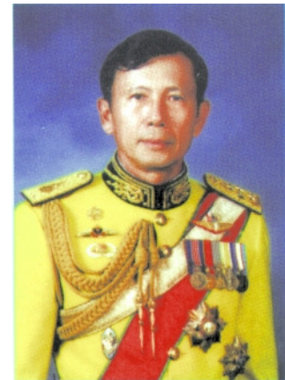
Supreme Commander Boonsrang Niumpradit

Supreme Commander der Streitkräfte Boonsrang Niumpradit , West Point-Absolvent und lange Jahre Force Commander der UNTAET in Ost-Timor, machte am Jahrestag des Coups am 19. September in Bangkok anlässlich der Jahrestagung der Honorary Trade Advisors und des Ministry of Commerce deutlich, dass das Militär Bestandteil der thailändischen Gesellschaft, dem Königshaus 5 treu verbunden ist und in diesem Zusammenhang stets gewährleistet wird, dass die legitimen Interessen des Volkes berücksichtigt würden. Nie würden sich die Streitkräfte gegen Volk und König stellen.