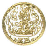
Office of the Honorary Trade Advisor

Das Jahr 2007 ist für das Königreich Thailand in vielen zentralen Bereichen von geradezu historischer Bedeutung. Nicht allein wegen der erwarteten „Rückkehr zur Demokratie“,