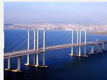
Der Welt längste Brücke steht in...?!