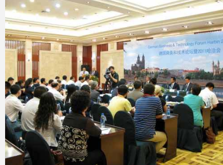
Green Tech Konferenzen weltweit. Harbin 2013

Neben der bloßen Teilnahme an dem Programm besteht die Gelegenheit zur Präsentation und Kontaktabbau. Sprechen Sie uns wegen eines individuellen Angebots direkt an.