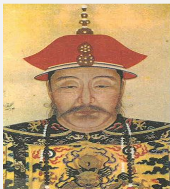
Nurhaci, 1529-1626, Erster Mandschu Kaiser und Begründer der Qing Dynastie