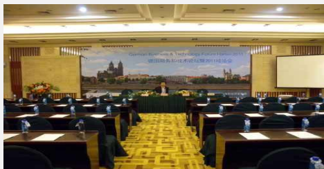
Green Cities – Green Industries – The Harbin Conference

Zielgruppe: Unternehmen, Institutionen, Wissenschaft, Entscheidungsträger aus Wirtschaft und Politik mit Interessen im Green Tech und Entwicklungsbereich.